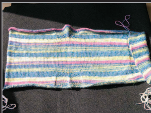
1. Offene Socke ohne Spitze

(Rück.-Reihe) die Maschen wie folgt stricken: 25 Maschen gerippt, 33 Maschen rechts, 26 Maschen Perlmuster, 32 Maschen links. Maschen auf der Nadel lassen, Faden nicht abschneiden, um damit später die Maschen für die Spitze aufzunehmen. Mit dem Endfaden vom Maschenanschlag die hintere Naht im Maschenstich zusammennähen (Bild 2). Für die Spitze mit dem Nadelspiel aus dem unteren Rand der Socke 52 Maschen gleichmäßig verteilt neu aufnehmen. 1 Reihen links stricken, weiter wie folgt: 12 Maschen Perlmuster (beginnend mit der 1. Masche nach der Naht), 3 Maschen überzogen zusammenstricken (2 Maschen zusammen wie zum Rechtsstricken abheben. 1 Masche rechts stricken, dann die beiden abgehobenen Maschen darüber ziehen), 23 Maschen Perlmuster, 3 Maschen überzogen zusammenstricken, 11 M. Perlmuster. Diese Abnahme noch 6 mal in jeder 2. Runde und 4 mal in jeder Runde wiederholen. Es sind noch 8 Maschen übrig. Diese Maschen mit dem Arbeitsfaden zusammenziehen. Faden auf der Innenseite vernähen (Bild 3).