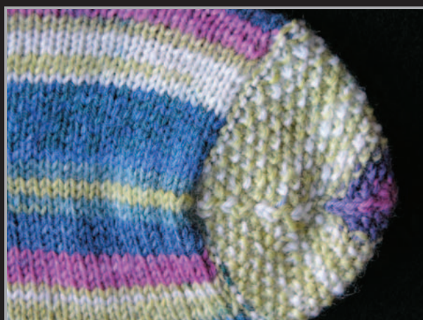
3. Spitze fertig