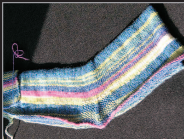
2. Offene Socke zusammengelegt, fertig um hintere Naht im Maschenstich zusammen zu nähen.